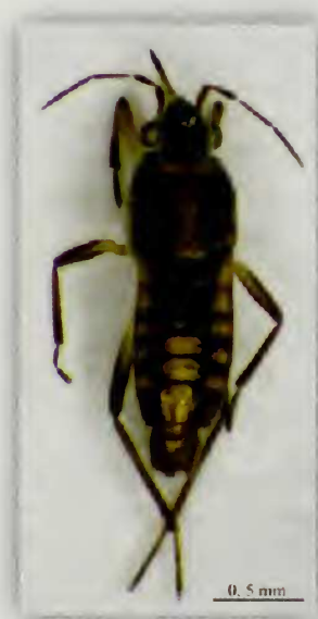
Fig. 9.- Habitus de Microvelia (Microvelia) gracillima R. (♂)

Material estudiado: La Palma: ▪ Cubo de La Galga, Puntallana, 548 m, 28RBS2884, 07/VIII/1992, 1 ex., 12/V/2002, 1 ex., 03/VII/2010, 2 exx. (R. García, leg.); 18/IX/2008, 9 exx., J.A. Régil, leg.; 26/IV/2010, 19 exx., SyG, leg. ▪ Caldero de Marcos y Cordero, San Andrés y Sauces, 1300 m,